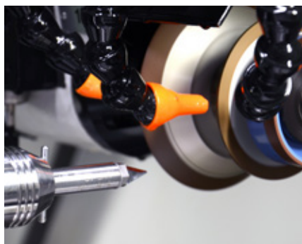
Réparation professionnelle en qualité du fabricant

Couteaux à ultrasons : précis, rapide et fiable !