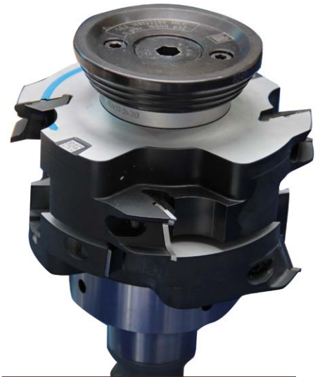
Leitz Hungária Szerszám Kft. 2030 Érd, Kis-Duna u. 6. Tel.: 23/521-900. www.leitz.hu

hogy hozzáférjünk valamennyi lapkát. A ProfilCut Q Premium-nál a kések könnyen hozzáférhetőek, egyszerűen cserélhetőek. Mivel a megnövelt élsebesség magasabb igénybevételnek teszi ki lapkákat, ezért azok biztos rögzítése az egyik legfontosabb feladat. A ProfilCut Q-nál az élkörfutás pontossága érdekében a lapkák mind tengely-, mind sugárirányban nagyobb precizitású rögzítést kívánnak meg. A hornyos és stiftes megoldás kiválóan vizsgázott a gyakorlatban is. Lapkacserétől függetlenül a szerszám-élkörfutás mindig ugyanaz, mint új korában. A ProfilCut Q szerszámrendszer univerzálisan alkalmazható a faipar számos területén, így alkalmasak nyílászáró, bútor, vagy akár padló megmunkálására egyaránt.