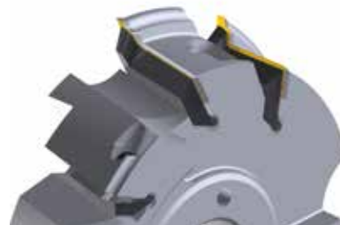
► Leitz Integral

A Leitz Hybrid technológia egyesíti a két Leitz szerszámrendszert, így csökkentve a feldolgozási költségeket kompozit anyagok, ragasztási fugával rendelkező frízek, valamint a nagy felületi kopásállósággal rendelkező laptermékek megmunkálásakor. Ez a szerszámkombináció egyesíti a HW-rendszerek és a gyémántkések előnyeit. Míg a kevésbé igénybe vett felületek megmunkálásánál a költséghatékony HW szerszámok végzik